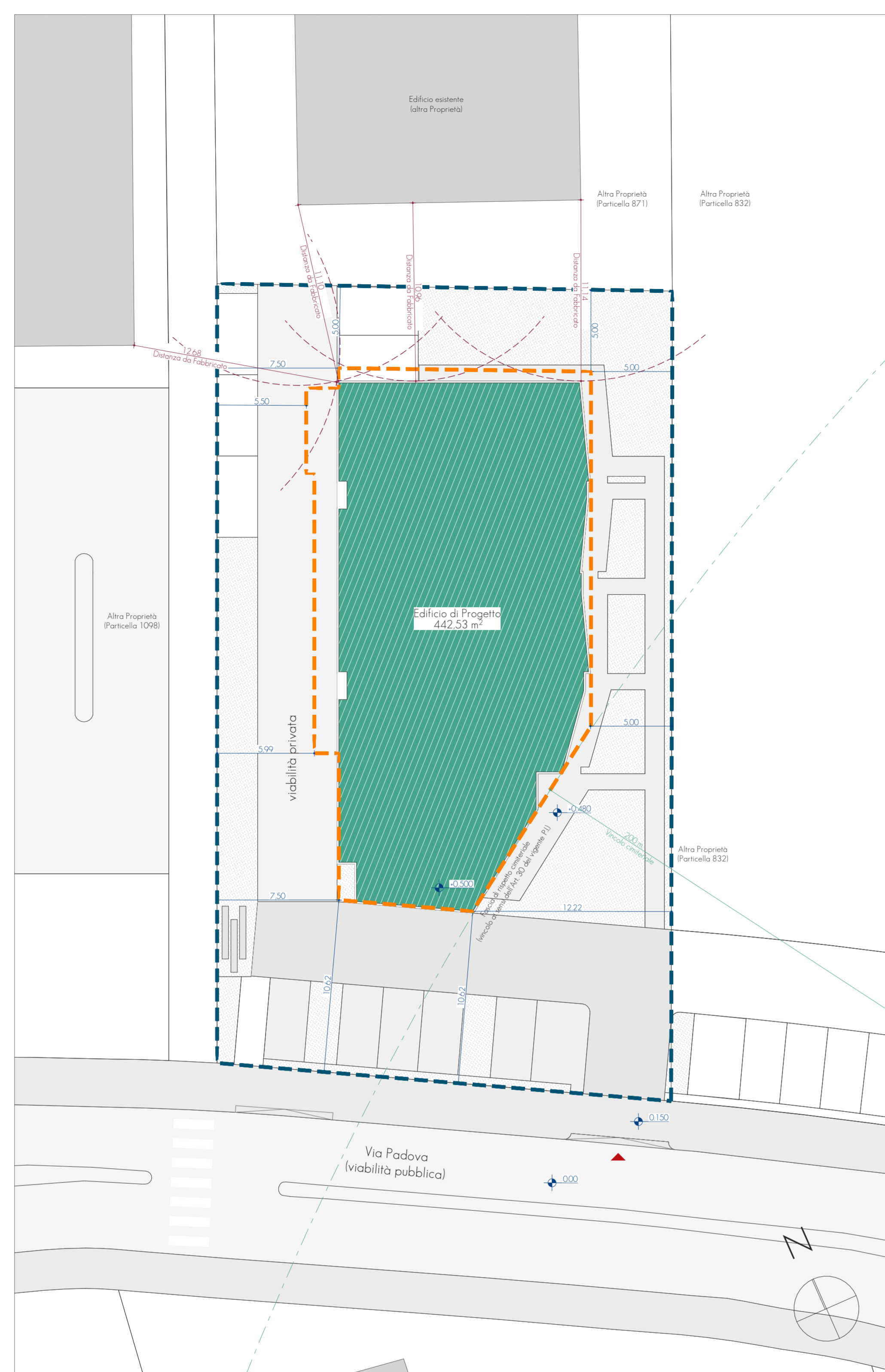
STATO DI PROGETTO Planimetrico 1:200