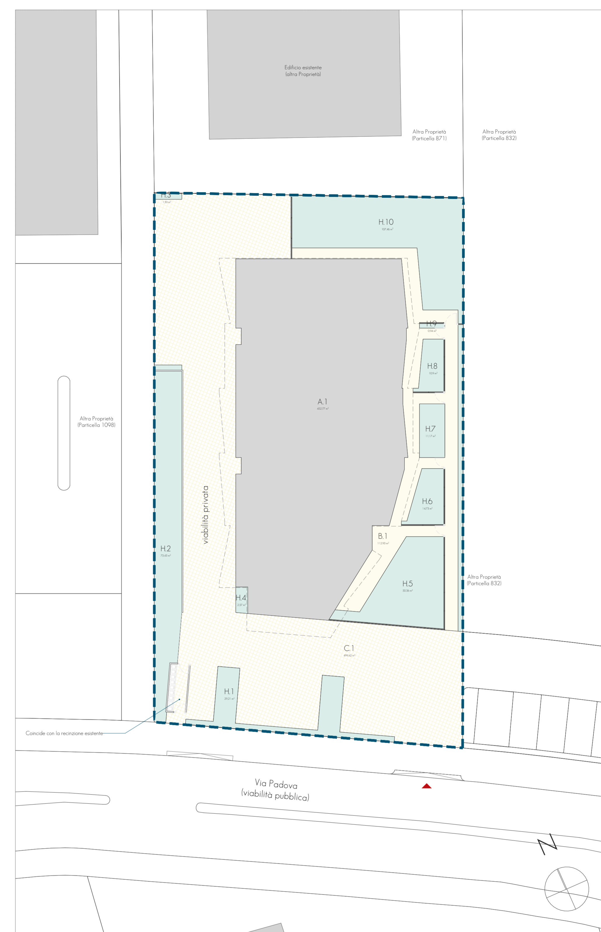
STATO DI PROGETTO Dimostrazione permeabilità dei suoli 1:200