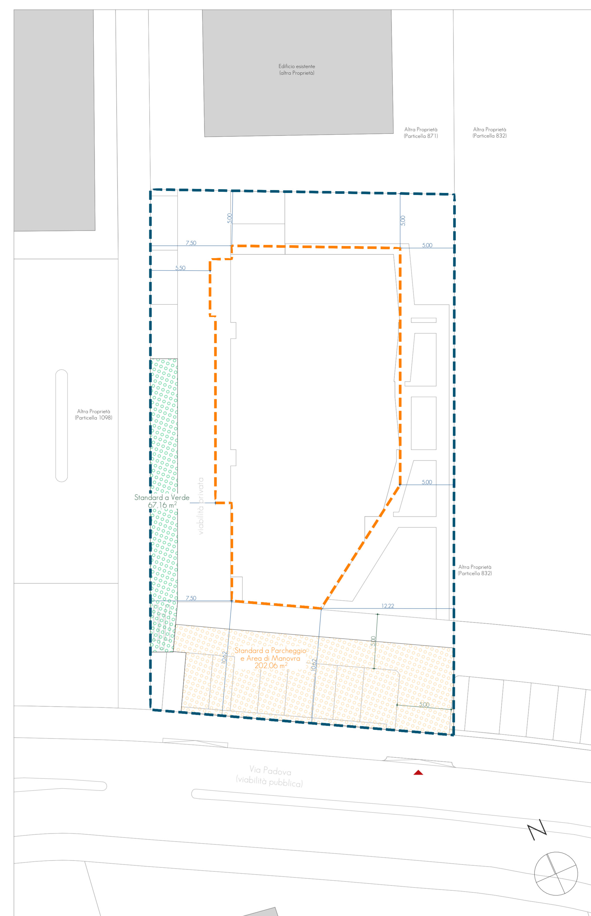
STATO DI PROGETTO Standard Urbanistici 1:200